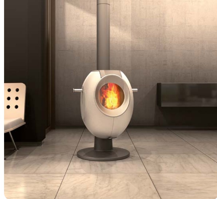
Design: GAAN Gabriela Vetsch, André Riemens

Die kubische Form des T-ONE STONE bringt Ihnen unaufdringliche Eleganz, die gradlinige, schnörkellöse Glasfront modernen Glanz. Das „gewisse Etwas“ ist dabei ein besonderes Extra: Mit dem optionalen Backaufsatz wird der T-ONE STONE zum Gourmet-Ofen. Geniessen Sie so mit bereits einer Holzladung über sechs Stunden wohlige Strahlungswärme, und backen Sie dabei gleichzeitig Pizza, Kuchen, oder ein duftendes Brot!