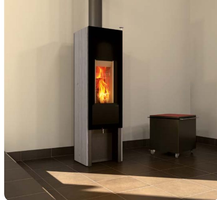
Design: GAAN Gabriela Vetsch, André Riemens

Sie wollen eine platzsparende, aber dennoch elegante Lösung? Der T-ONE SWING besteht mit nach hinten gewölbten, aus gegossenem Stein geformten Seitenwänden. Durch die rahmenlose Glastür, bietet sich Ihnen ungetrübte Sicht auf das einmalige Flammenspiel der aufrecht platzierten Holzscheite. Geniessen Sie bereits kurz nach dem Anfeuern die erste wohlige Wärme, für einen gemütlichen Abend in Ihrem Zuhause.