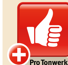
Design: GAAN Gabriela Vetsch, André Riemens