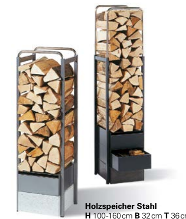
Holzspeicher Stahl H 100-160cm B 32cm T 36cm