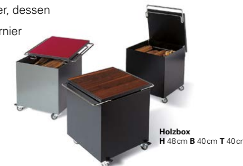
Holzbox H 48cm B 40cm T 40cm