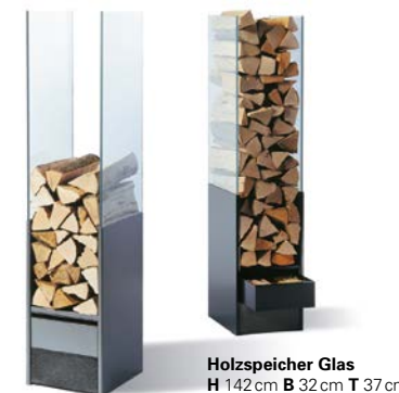
Holzspeicher Glas H 142cm B 32cm T 37cm

Wer sein Feuerholz lieber diskret lagert, für den ist die praktische Holzbox genau das Richtige. So kann man Holz und Kehrgarnitur in separaten Fächern verstauen und hat gleichzeitig einen dekorativen Hocker, dessen Deckel mit Holzfurnier oder farbigem Filz bezogen ist.