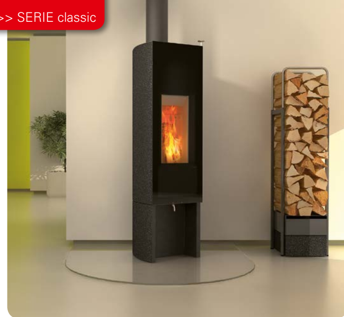
Design: GAAN Gabriela Vetsch, André Riemens