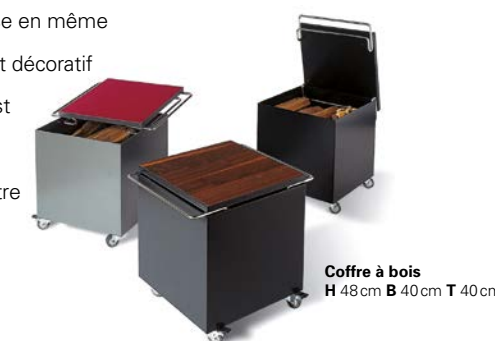
Coffre à bois H 48cm B 40cm T 40cm