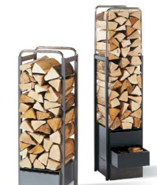
Élément de rangement en acier H 100-160cm B 32cm T 36cm