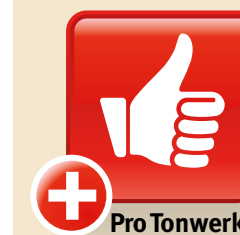
Design: GAAN Gabriela Vetsch, André Riemens