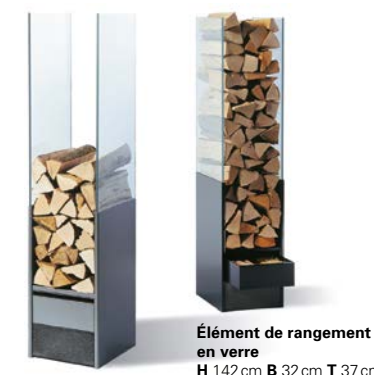
Élément de rangement en verre H 142cm B 32cm T 37cm

Quiconque préfère entreposer discrètement son bois de chauffage devrait plutôt opter pour la boîte en bois discrète. Ainsi, il peut ranger son bois et les accessoires de balayage dans des compartiments séparés, et il dispose en même temps d'un tabouret décoratif dont le couvercle est revêtu d'un placage de bois ou d'un feutre coloré.